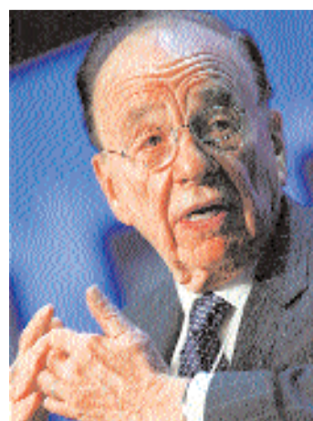
Medienzar Robert Murdoch.

ten, verneinte Murdoch. «Wir würden es vielleicht gerne, aber wir können es nicht.» Er verwies auf den Irak-Krieg, den sein Konzern publizistisch unterstützt habe.